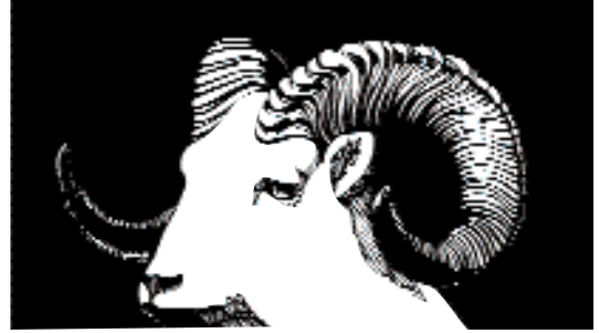
Bir koç başı