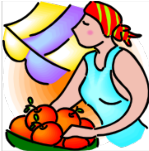
She is carrying a basket now.