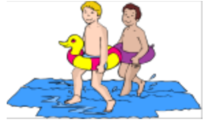
They are walking now.