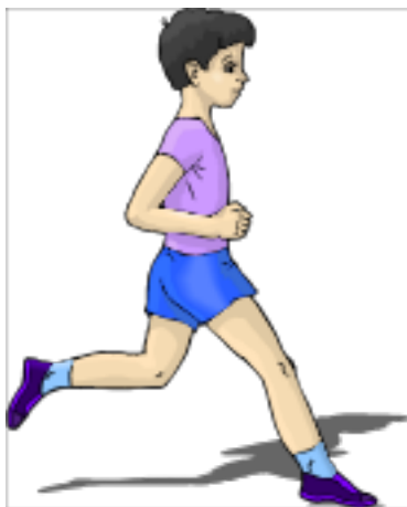
He is running now.