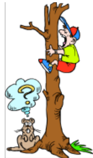
He is climbing the tree now.