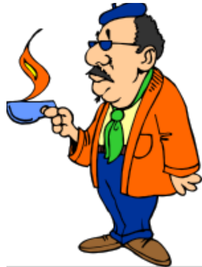
He is drinking coffee now.