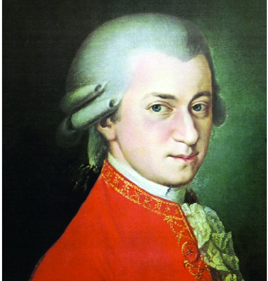
Resim 4.2: Wolfgang Amadeus Mozart

Fransa'da Aydınlanma Çağı'nın düşünürleri arasında, Monteskiyö, Ruso ve Volter yer aldı. Bu insanlar yazılarıyla baskı ve zulme karşı mücadele ettiler. Ogüst Komt ve Emile Durkaym sosyoloji ilminin konularını belirlediler. Adam Smith ekonomide yeni bir çığır açtı. XVIII. yüzyılda Hendel, Bach (Bah), Haydn (Haydın) ve Mozart gibi ünlü müzik adamları yetişti (Resim 4.2).