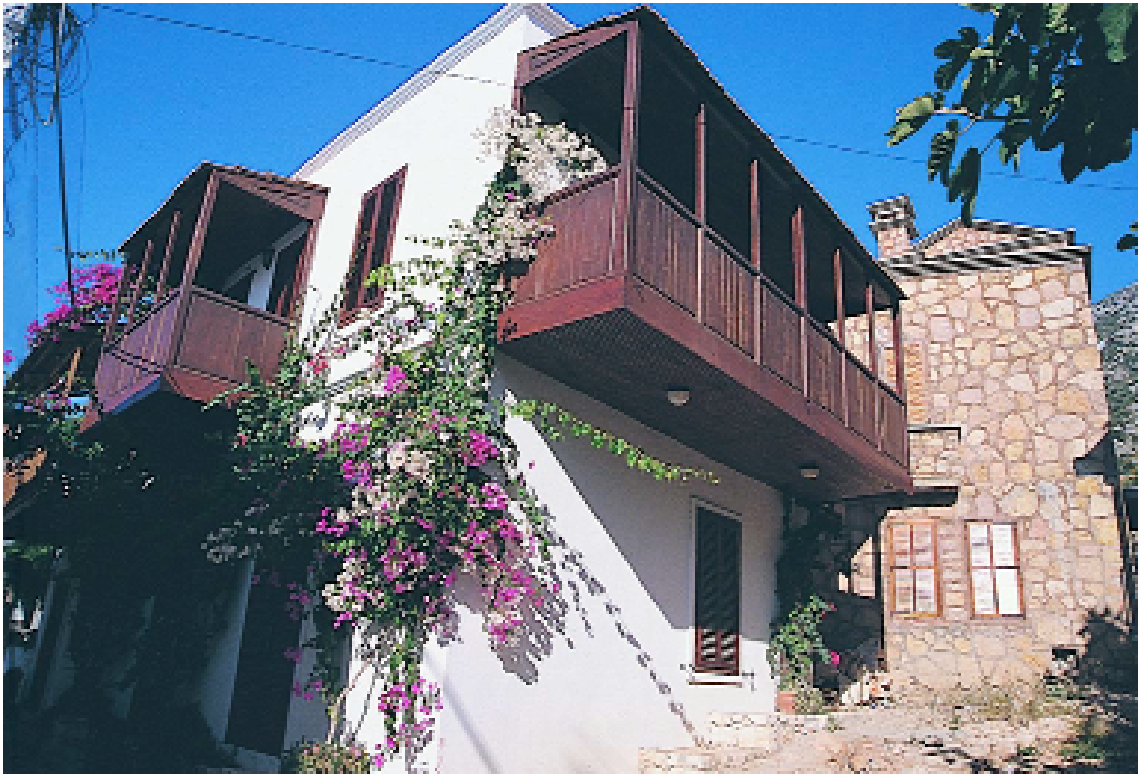
Resim 5.2: Şirin bir pansiyondan görünüm