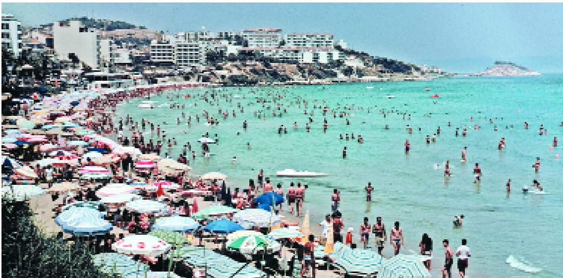
Resim 5.1: Deniz, kum ve güneşin birleştiği sahilden bir görünüm